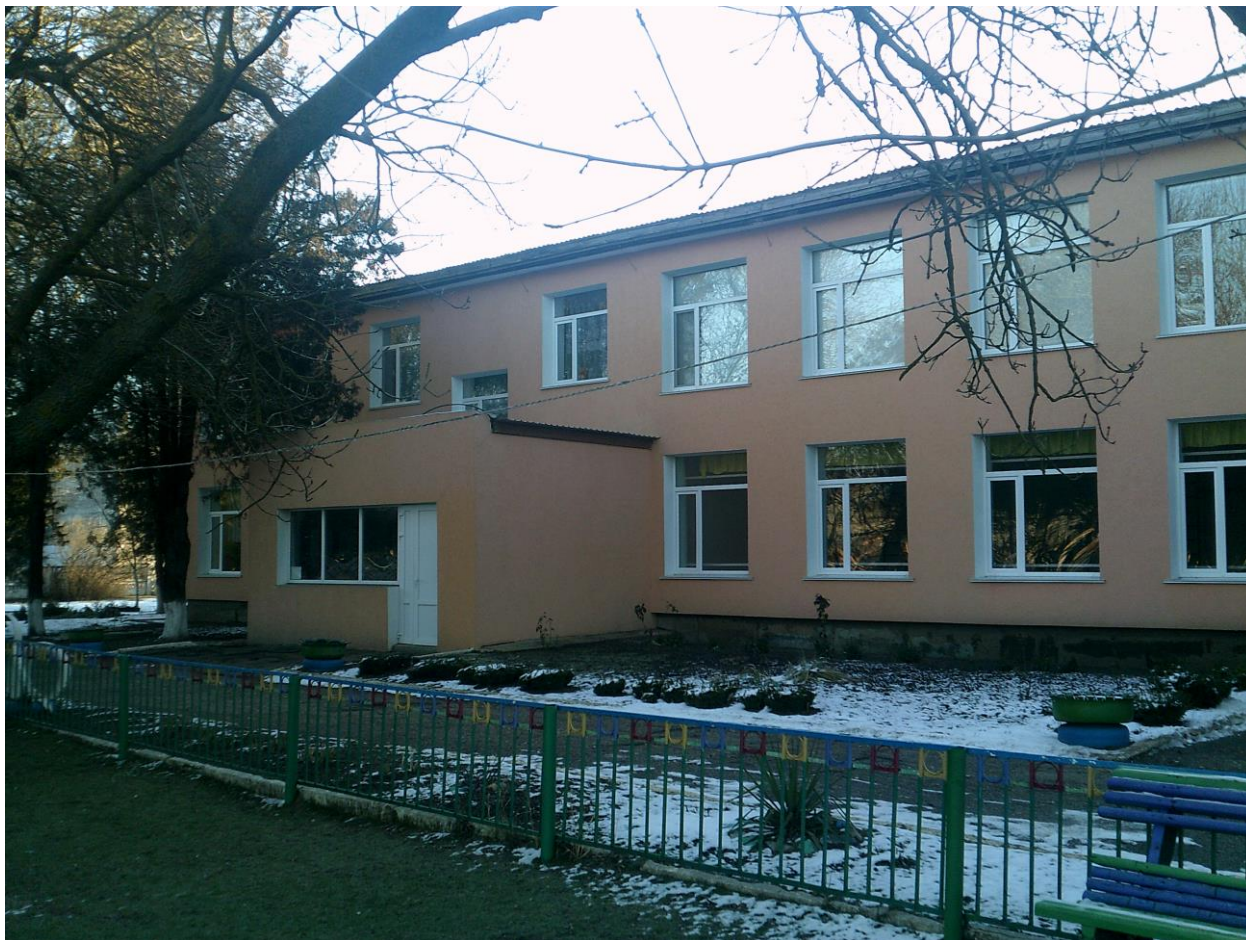
Фото №1. Территория, прилегающая к зданию (участок).